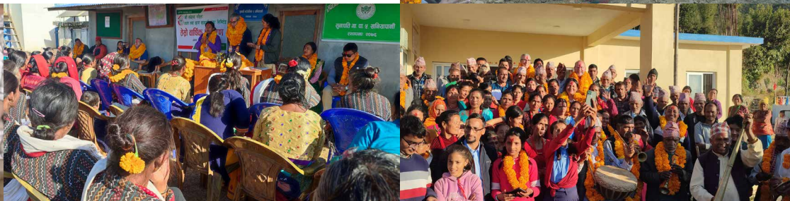
Photo: Echange avec le groupe de femmes.

Au Sénégal , nous sommes accueillis à l'aéroport par notre partenaire. Soirée de retrouvailles. La première journée est consacrée à élaborer ou confirmer le calendrier de la mission. Sous une chaleur de plomb, loin du goudron sur des pistes de latérite rouge, nous faisons le tour de toutes les réalisations prévues dans nos actions. En plus des rencontres officielles avec les autorités locales et régionales, nous répondons aux nombreuses invitations des bénéficiaires du projet, moments