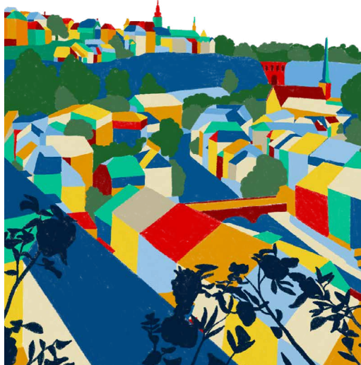
Illustration ci-dessus : Page de couverture du calendrier PSF 2024.

Chèr(e) membre, donat(rice)eur et sympathisant(e),