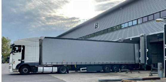
Photo ci-contre: Conférence de presse. Photo à gauche: Camion chargé de matériel médical.