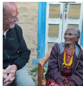
Photos (Népal) : Ci-contre et de haut en bas. Interaction avec une patiente souffrant de la cataracte. / Pose de la pierre fondatrice à Lama Tole avec la bénédiction des moines / Inauguration du CHU de Gunsi.

Au Sénégal , nous sommes accueillis à l'aéroport par notre partenaire. Soirée de retrouvailles. La première journée est consacrée à élaborer ou confirmer le calendrier de la mission. Sous une chaleur de plomb, loin du goudron sur des pistes de latérite rouge, nous faisons le tour de toutes les réalisations prévues dans nos actions. En plus des rencontres officielles avec les autorités locales et régionales, nous répondons aux nombreuses invitations des bénéficiaires du projet, moments