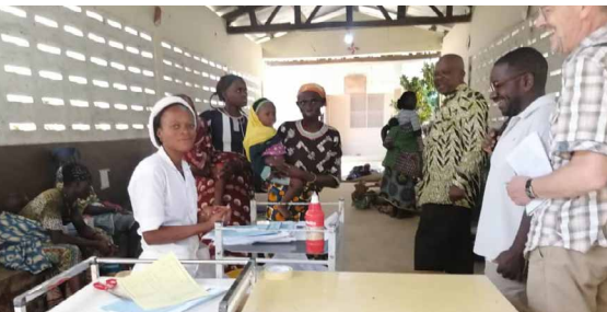
Photo: Visite du service pédiatrie de l'hôpital de Bembèrèké.

Au Népal , l'accueil par les communautés est très chaleureux, voire festif. Lors de notre dernière visite en décembre 2022, on a été par exemple invités à célébrer avec le groupe de femmes la Journée Internationale du Volontariat et des droits de la femme. Ce fut une expérience unique de participation active à un rallye. L'interaction avec les groupes de femmes est toujours l'occasion pour avoir un échange culturel et pour leur exposer des problématiques semblables dans nos sociétés. L'inauguration du poste de santé de Gunsi a été fêtée par toute la communauté : accueil par la fanfare, démonstration de danse par les enfants, visite du poste et remerciements à toutes les parties prenantes. Une expérience inédite fut aussi la pose des fondations du réservoir du système d'adduction en eau potable de Lama Tole, où on a pu participer à la bénédiction par les moines du monastère limitrophe. On a aussi eu l'honneur de pouvoir rendre visite à une patiente âgée de 81 ans qui a pu retrouver la vue grâce à une opération de la cataracte facilitée par le projet. Finalement, l'interaction avec l'équipe locale de notre partenaire nous tient toujours à cœur et permet de créer des relations particulières, voire amicales. Ce sont ces rencontres qui restent gravées dans notre mémoire.