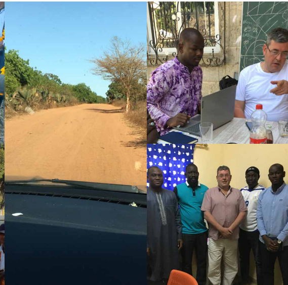
Photos: De gauche à droite et de haut en bas. Visite des infrastructures. / Séance de travail avec le partenaire. / Rencontre au niveau du District sanitaire de Sokone entre le partenaire et le médecin chef.

toujours chargés en émotions. De temps en temps, il faut aussi susciter des réunions avec les bénéficiaires pour leur rappeler parfois avec force, leurs devoirs et engagements envers le projet. Il arrive aussi que les bénéficiaires présentent aux partenaires des doléances auxquelles PSF ne peut pas répondre. Les journées passent très vite, commencent tôt le matin et se terminent tard le soir, surtout lorsque nous sommes invités à des émissions radio. Lors de notre dernière mission en mars 2023, nous avons en plus pu visiter 3 nouveaux sites qui pourraient être intégrés dans un prochain accord-cadre. Après 9 jours de mission, retour au froid, mais pleins de motivation.