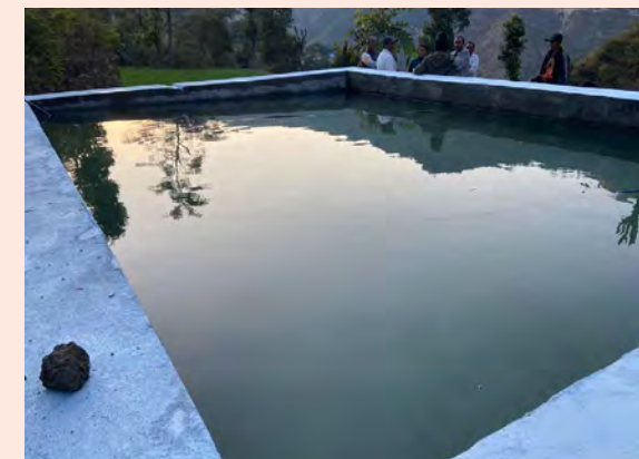
Photo : Bassin de rétention d'un système d'irrigation pour surfaces agricoles (Népal)