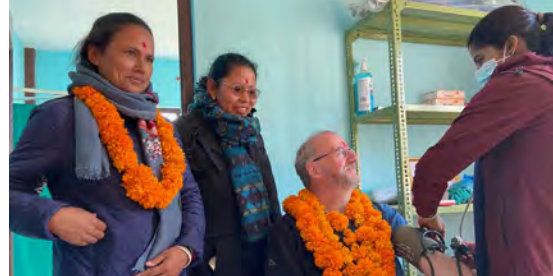
Photo: Vérification de la tension artérielle (de g. à dr.: vice-maire de Sunapati, Responsable santé du district, Camille (PSF) et une femme bénévole - santé communautaire) (Népal)

A Zogbodomey les actions pour l'implantation de la mutuelle de santé scolaire ont commencé avec des tournées de prise de contact et de sensibilisation et formation des acteurs (surveillants et pairs éducateurs). Afin d'inciter à plus d'affiliations, les établissements scolaires ont été soutenus par la prise en charge de divers matériels et équipements (latrines, matériel pour le sport, matériel informatique, etc.). Un investissement a été opéré également dans du matériel (une moto) pour le personnel d'encadrement du projet.