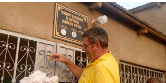
Photos ci-dessous, logement de la sage-femme, inauguration (Sénégal).

2 e année, nous avons eu des retours de satisfaction des parents dont les enfants (en tout 64 garçons et 50 filles) ont reçu des soins pris en charge par la mutuelle. Qui plus est, cela contribue à la baisse du taux d'absentéisme scolaire.