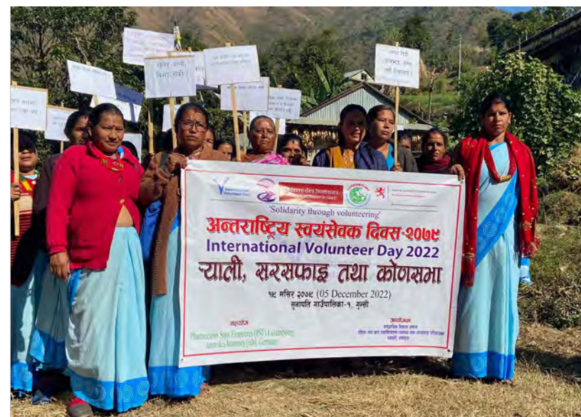
Photo : Célébration de la journée internationale du bénévolat (Népal).

Népal: Les 37 volontaires communautaires féminines de la santé (FCHV) formées en 2021, sont toujours opérationnelles en 2022. En ce qui concerne la formation d'accoucheuse qualifiée, sur les 8 stagiaires sélectionnées en 2021, 2 ont pu être formées et sont déjà actives. En raison de problèmes organisationnels et à de longues listes d'attente, les 6 autres seront formées en 2023.