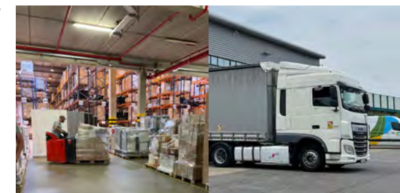
Photos: (de gauche à droite et de haut en bas). 1 et 2: Chargement d'un camion à Luxembourg / 3 et 4: Arrivée du camion en Ukraine, déchargement et distribution.

Deux convois ont ainsi été envoyés en collaboration avec nos partenaires, le dernier datant de fin août. Le camion en question, arrivé à bon port, transportait plusieurs machines pour le traitement plus rapide des plaies, des dispositifs médicaux (aiguilles, seringues à insuline, bandages et tourniquets), des chariots médicaux, des matelas médicaux et les draps adéquats, du mobilier médical ainsi qu'un assortiment de produits pharmaceutiques.