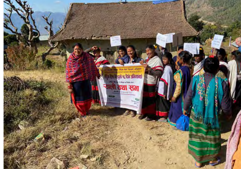
Photo : Rallye organisé par un groupe de femmes pour sensibiliser à la non-violence envers les femmes et les jeunes filles

Les infirmiers/ières scolaires ont bénéficié de 2 stages formatifs dans les centres Amour & Vie de Godounov et de N'Dali, reconnus comme de véritables pôles spécialisés dans l'écoute et l'orientation des jeunes ainsi que dans le domaine de la santé de la reproduction.