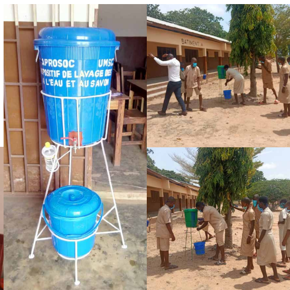
Photos: Installation de fontaines pour le lavage des mains dans les écoles (Bembèrèkè)

Avec l'appui de PSF, notre partenaire l'ONG APROSOC a fait don de 7.000 masques pour les élèves et enseignants et de lave-mains pour les infirmeries des collèges et lycées de la commune de Bembèrèkè.