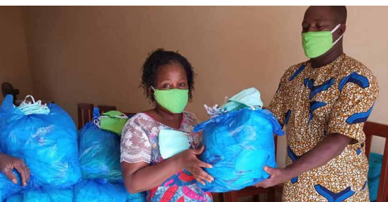
Photo: Distribution de masques

Avec l'appui de PSF, notre partenaire l'ONG APROSOC a fait don de 7.000 masques pour les élèves et enseignants et de lave-mains pour les infirmeries des collèges et lycées de la commune de Bembèrèkè.