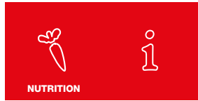
Photo: Distribution de nourriture