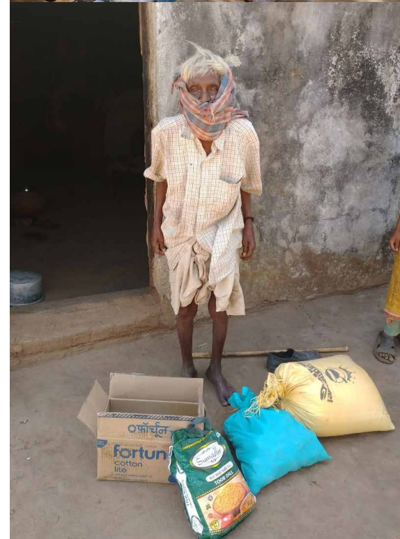
Photos: Distribution de kits de survie / Bénéficiaire d'un kit de survie