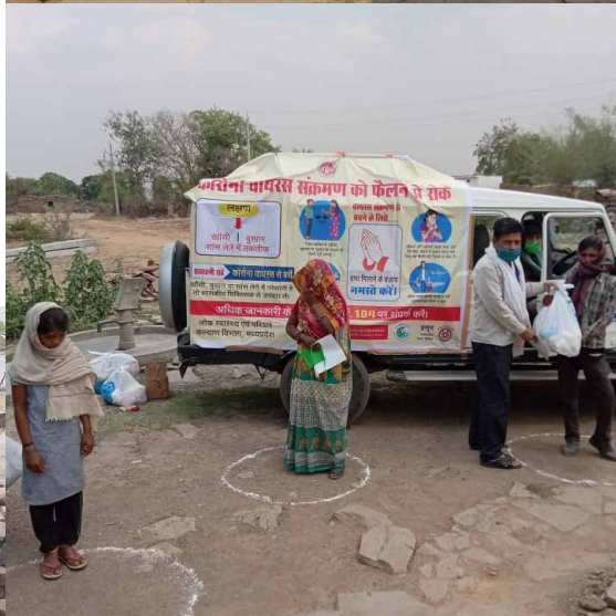
Photos: Distribution de nourriture et affiches de sensibilisation / Distribution de masques