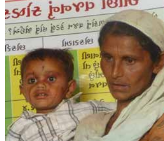
Photo: Mamta Diwas, check-up des femmes enceintes

Photo: mère et enfant lors de réunion avec les gestionnaires de projet en visite