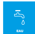
Photo: Construction d'un point d'eau