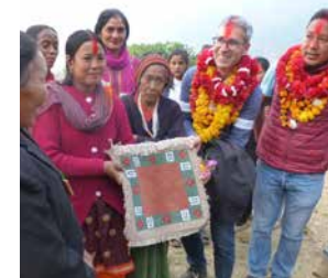
Photo à droite: Groupe de femmes présentant leur broderie de tapis (nouvelle source de revenu)