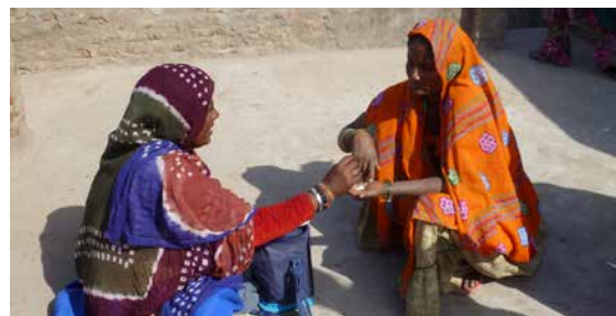
Photo: Une patiente reçoit des médicaments de la trousse de la health worker

Photo ci-dessus: mère et enfant lors de réunion avec les gestionnaires de projet en visite