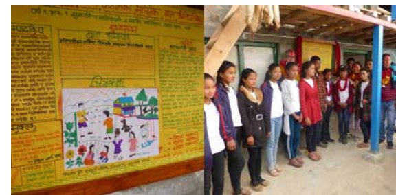
Photos au dessus: Poster présenté par le groupe d'enfants lors de la Journée mondiale sur l'environnement