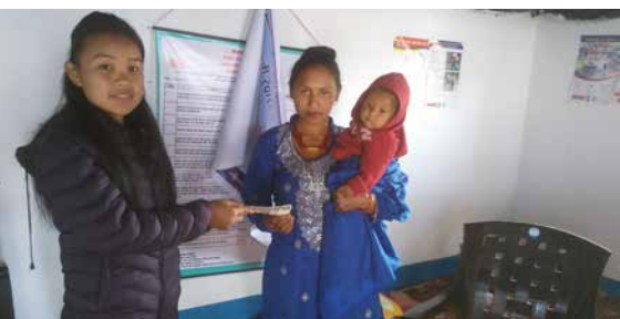
Photo: Remise de NPR 1000 (= 8€) pour avoir suivi quatre tests prénataux