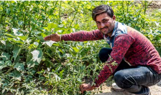
Photos: Kitchen gardens (aubergines, tomates, courges, herbes, épinards...)