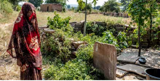
Photo: Kitchen garden familial arrosé avec l'eau de la douche extérieure!